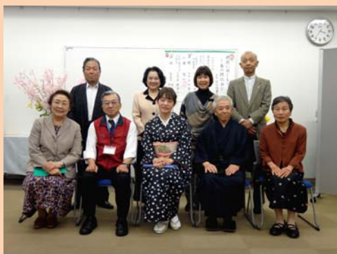
朗読会終了後、館長も一緒にパチリ。