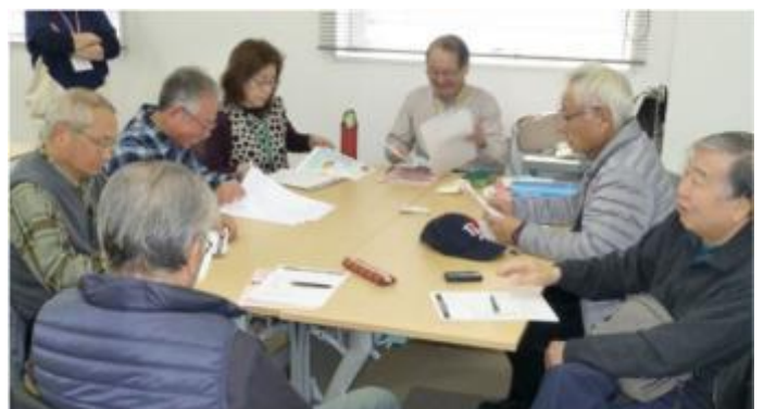
広報部会のスナップ