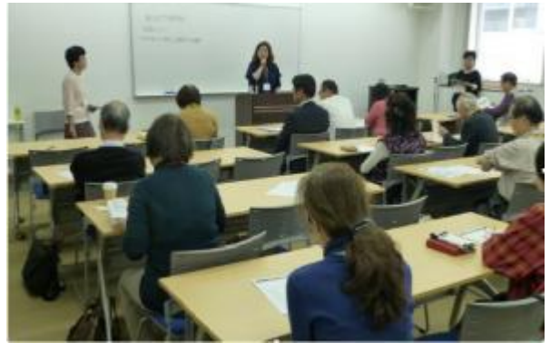
クラス幹事会のスナップ