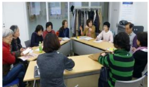
総務部会のスナップ