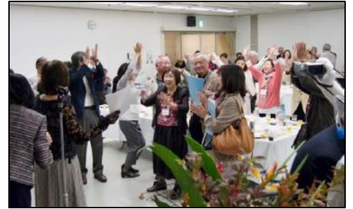
(開学十周年を祝う会)

③「交流・交歓」外部諸機関・諸団体との接触を密にし、そこで得られた情報を会員や卒業生の活動グループと共有したり、逆にいろいろな情報を提供したりすることにより、新しい関係づくりを目指していきたいと思います。