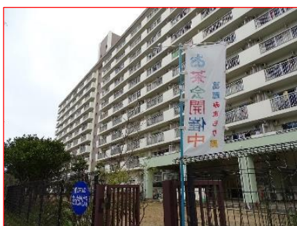
お茶会開催中の幟（のぼり）

最後に「なぎさ和楽苑」の方からスマホの使い方や介護予防教室のお知らせなどの説明を頂きました。