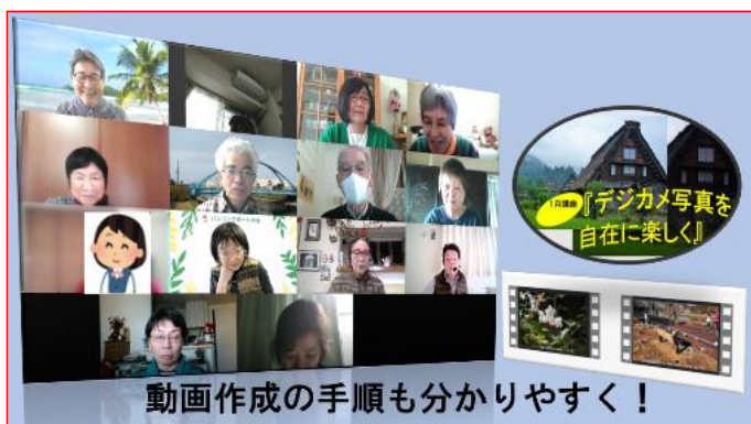
動画作成の手順も分かりやすく！