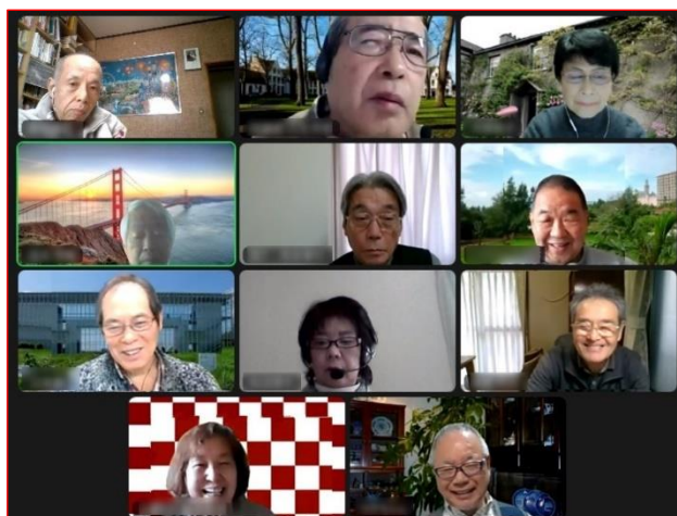
リモート役員会の様子

コロナ禍の制限はあっても、同窓会が人生大学卒業生の交流の場となるように、役員会としても力を尽くしていきます。