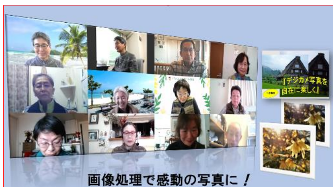
画像処理で感動の写真に！

1月29日（金）午前、午後の2回、それぞれ1時間30分、『デジカメ写真を自在に楽しく』講習会を開きました。「写真の今」を少しでも理解し、映像を通して楽しんでいこうという内容です。受講者は午前3名、午後7名でした。