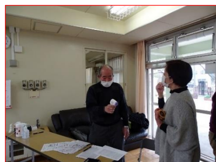
マスクと検温の徹底